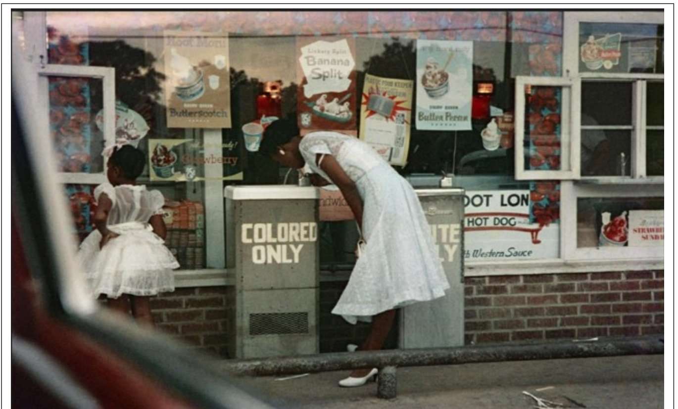
Gordon Parks. Drinking Fountains, Mobile, Alabama, 1956