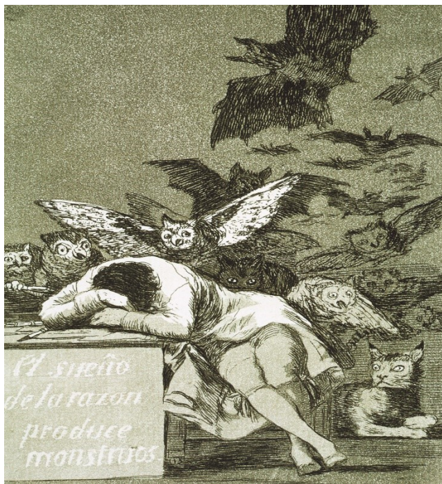
(Francisco Goya, 1797)

Ho insegnato fisica fino ai 75 anni, ossia fino a 22 anni fa. Per me e per i miei colleghi l'America, gli Stati Uniti d'America, erano un sogno, la Mecca. Dopo il tramonto della supremazia scientifica della Germania, indebolita dalla persecuzione nazista dei grandi scienziati tedeschi ebrei, e infine dalla sconfitta nella Seconda guerra mondiale, gradualmente gli USA si sono affermati come preminenti in tutti i settori scientifici. Ne sono testimonianza i molti Premi Nobel assegnati ai loro scienziati.